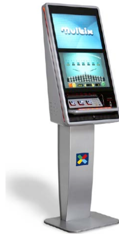
Norsk Tipping / Foto: Flemming Stoldal